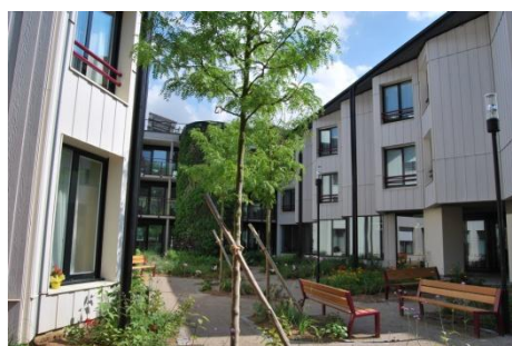
Un parc aménagé